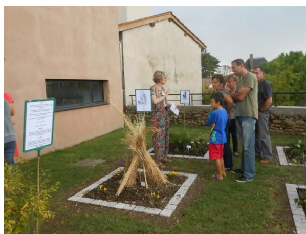
Dernières réalisations Dieu Océan et jardin romain