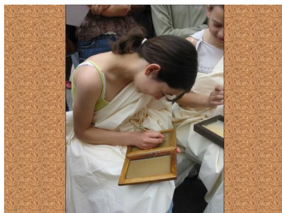
De nombreux ateliers pour les enfants