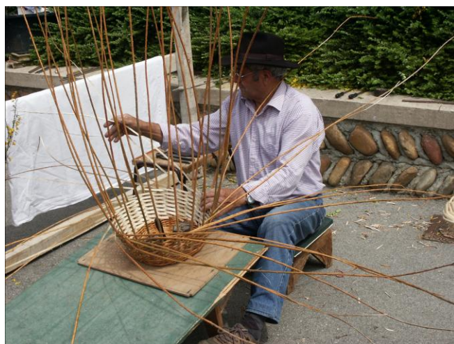
Les artisans en première ligne

Les animations et l'infrastructure sont assurées par les associations de Clonas, la fête a lieu PAR et POUR les clonarins en priorité.