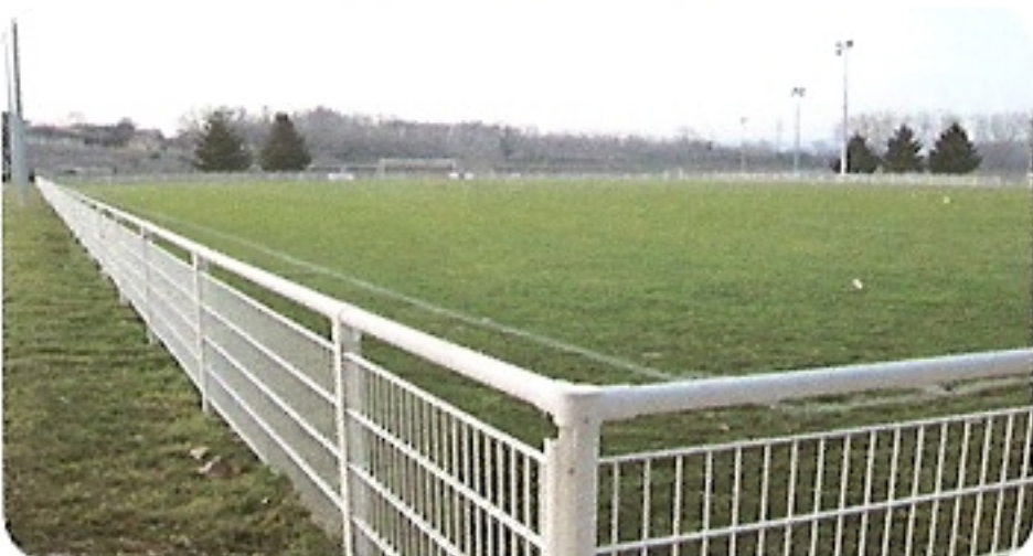
EQUIPEMENTS TOUS SPORTS