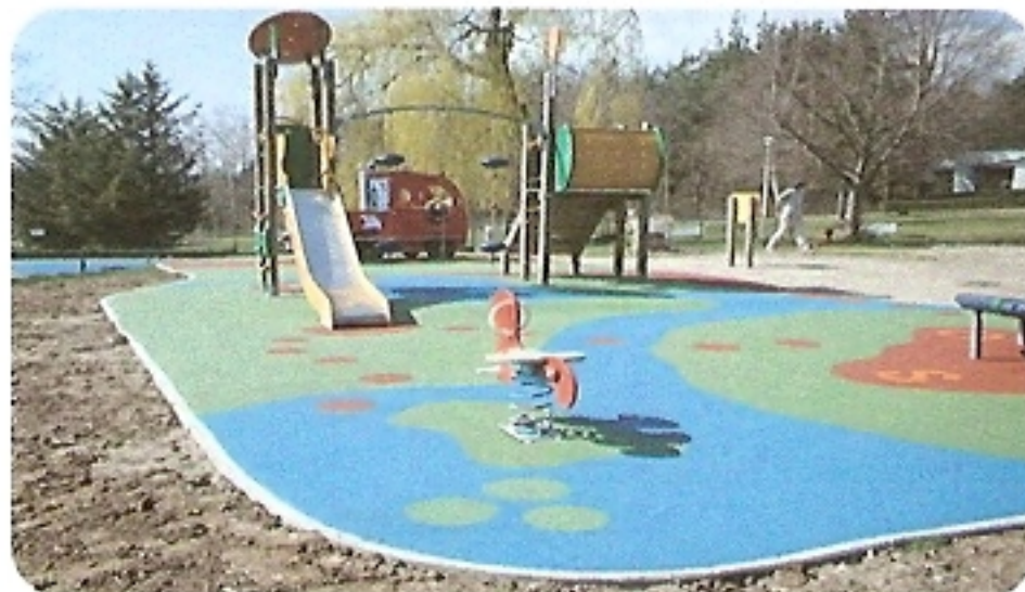
JEUX ET STRUCTURES