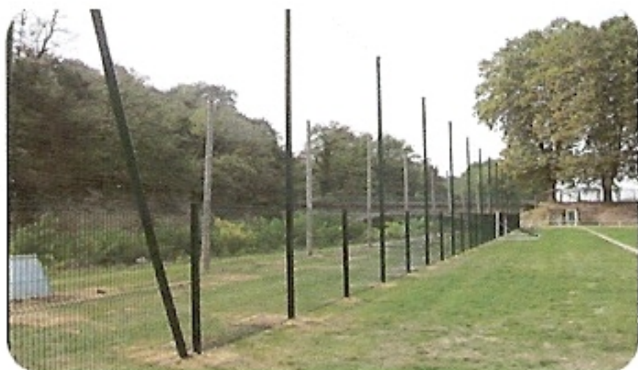
MAIN COURANTE, CLÔTURE FILET PARE-BALLON